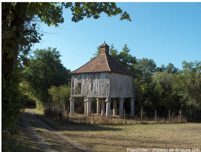
Pigeonnier - château de Briçoire (24)

Pour préserver leur authenticité et les transmettre aux générations futures, il faut comprendre et expliquer ces héritages du passé, en faire un bien collectif partagé.