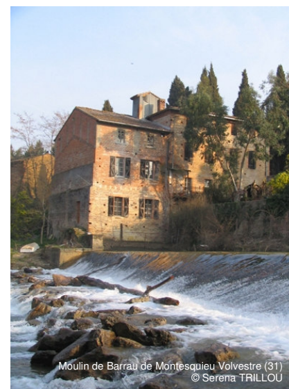
Moulin de Barrau de Montesquieu Volvestre (31)